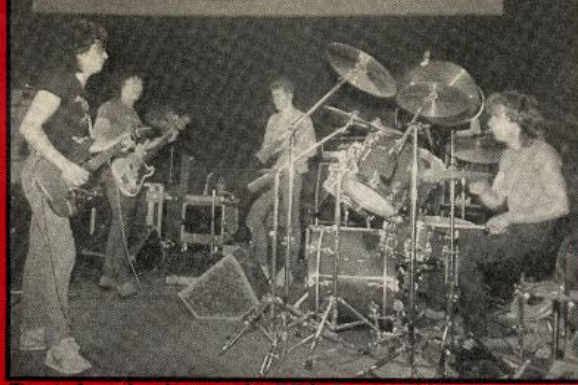
Trust dans les locaux du BBO International Holding. Un building entier pour les travaux d'Hercule que sont les répétitions qui précèdent une tournée de cent dates.