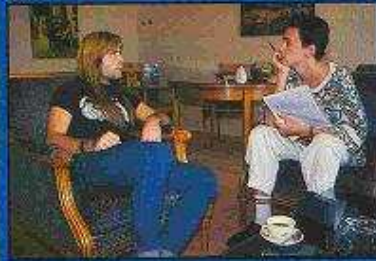
Notre reporter en train de poser des questions au chanteur d'Iron Maiden : Bruce Dickinson.

C'est ce que l'on pourrait appeler l'analyse préliminaire non approfondie !