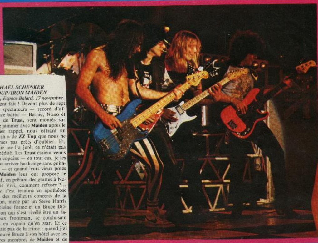
Trust et Maiden, le pacte de feu !