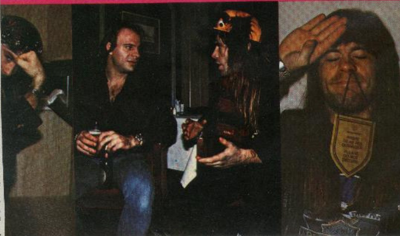
Bruce refusant d'être dérangé.