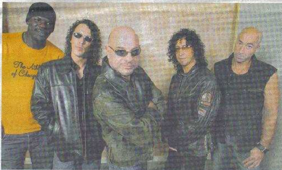
Trust, toujours aussi vrai

TRUST • Jeudi 16 octobre à 20 heures • Zénith de Dijon • Tarifs : 45 €, 35 € • Renseignements et location : Oxa production, 28, rue des Trois-Forgerons à Dijon (03.80.41.03.33 www.kloukan.com) • Billetteries : le Bien public, 03.80.42.44.44, du lundi au vendredi de 8 h 45 à 12 heures et de 14 à 18 heures ; magasins Fnac, Carrefour, Géant Casino, Gibert Music à Dijon, Coulénot Music à Beaune